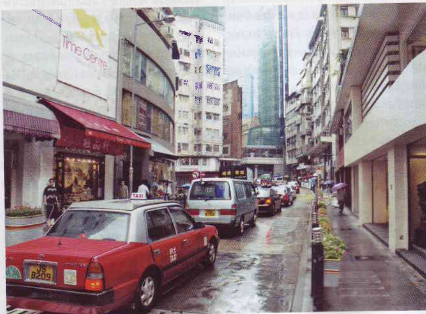
« Canyon » de Hong Kong.

Exemple au bureau pour l'efficacité énergétique (EEO) du départ-