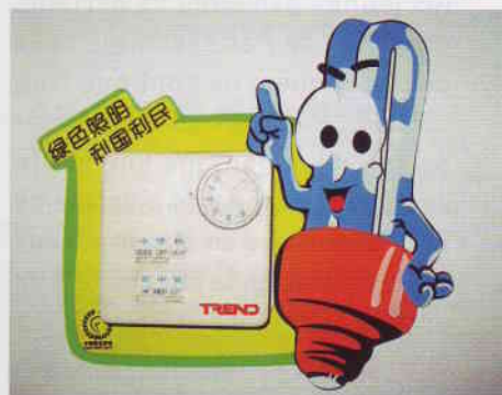
Placé sur les boîtiers de réglage de la climatisation, l'autocollant CFL sourit aux économies d'énergie.

Aux yeux de la direction de l'université, ceci justifie d'investir dans un complément « soft » à tout ce « hardware ». Placardage sur les portes des toilettes (emplacement à forte visibilité !) de graphes décrivant l'évolution des consommations énergétiques de l'établissement, autocollants pédagogiques, audits énergétiques et proposition d'une charte interne cherchent ainsi à faire adopter des comportements plus vertueux. ■